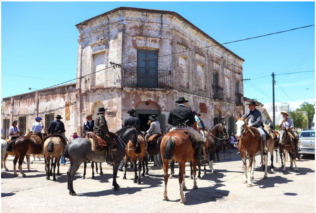
Figura 2. Síntesis de las formas arquitectónicas típicas de lo rural del casco histórico y la tradición gauchesca. Desfile de la Fiesta de la Tradición 2024.

Identificamos en los considerandos del decreto la superposición de dos narrativas fundacionales (Figura 2). La primera comparte un carácter histórico y arquitectónico, enfatizando la relevancia de la localidad en el contexto de la ocupación territorial durante la expansión colonial, ciertos sucesos considerados de relevancia y la construcción política e institucional