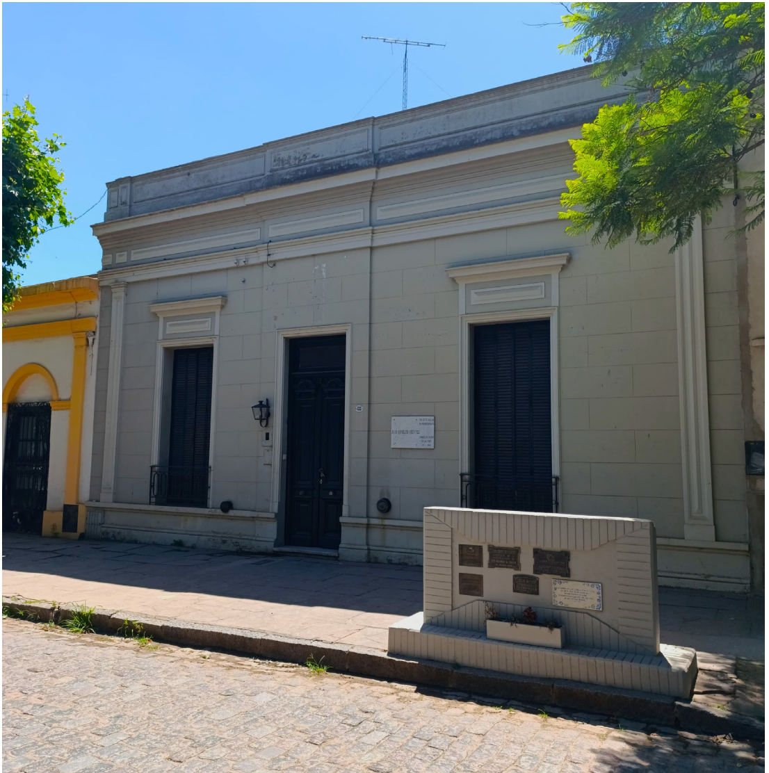
Figura 5. Construcción actual emplazada en el solar donde naciera Juan H. Vieytes en 1762. Reconocida como “Lugar Significativo”. Contemporary building located on the site where Juan H. Vieytes was born in 1762. Recognized as a “Lugar Significativo” (Significant Place).

Francisco Álvarez (5) fue otro propietario de tierras y cautivos/as que residía en el ámbito urbano. Como se muestra en la Tabla 2, su plantel era considerablemente extenso, ya que comprendía a más de una decena de individuos. Se puede suponer que el número de mano de obra esclavizada tenía relación con la extensión de sus propiedades urbanas, las cuales, como hemos mencionado, alcanzaban casi tres cuadras, lo que le permitía, al menos en un sentido potencial, poseer una pequeña majada de ovejas o desarrollar una producción forrajera, hortícola y frutal. Aquí, además, se da una situación